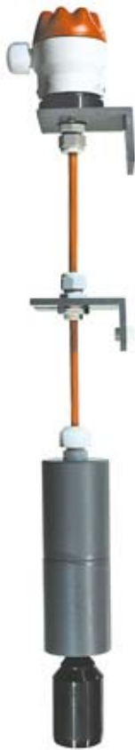
MAXIMAT LW- VK- K