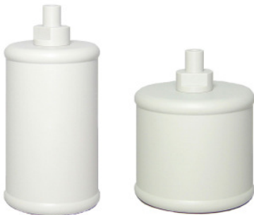
Schwimmer S 78 S 98

*) die Skala ist nicht im Lieferumfang enthalten, sie ist optional zusätzlich erhältlich